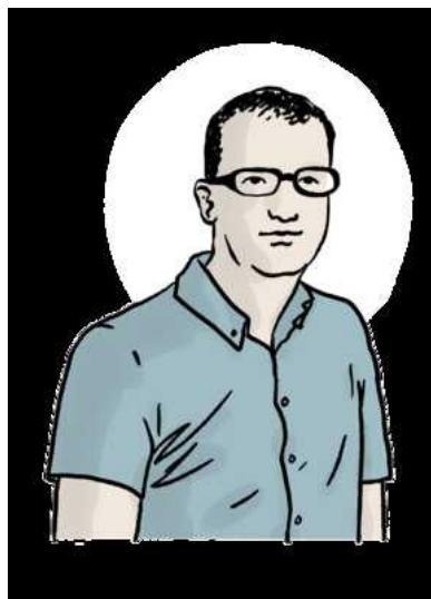
Illustratie Luis Mendo