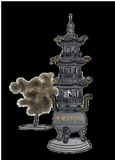
Illustratie Luis Mendo