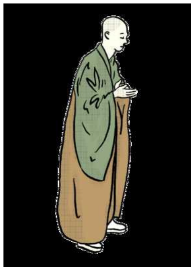
Illustratie Luis Mendo